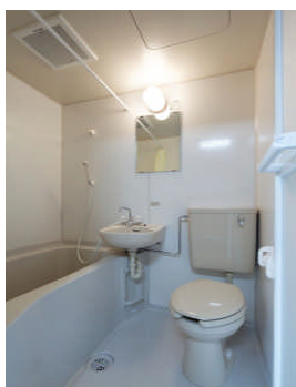
ユニットバス完備