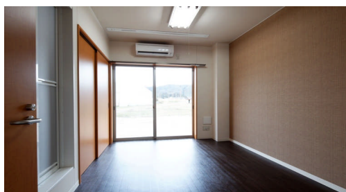
約6畳の個室・エアコン完備